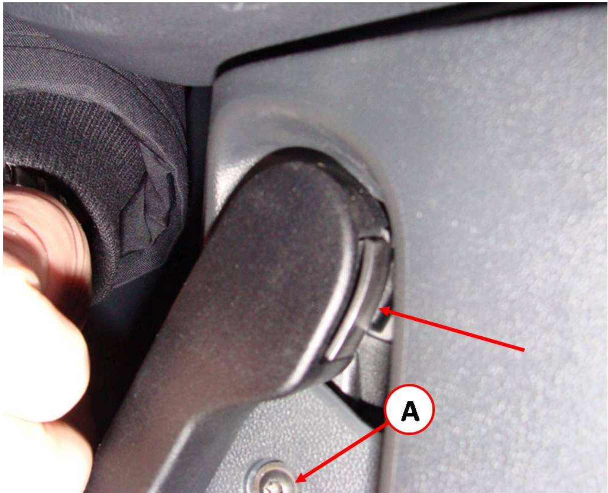
Abbildung 2 Entriegelungshebel Motorhaube

Jetzt die Schraube an Pfeil „A“ herausdrehen.