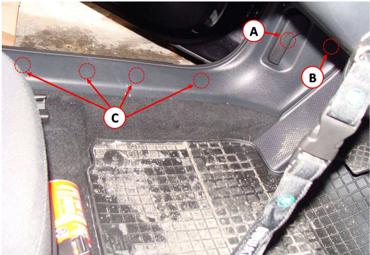
Abbildung 3 Schwellerverkleidung Innenraum Fahrerseite

Die untere A-Säulenverkleidung (der Teil der Schwellerverkleidung Richtung Motorraum) kann durch abziehen der Halteklammer „B“ gelöst werden.